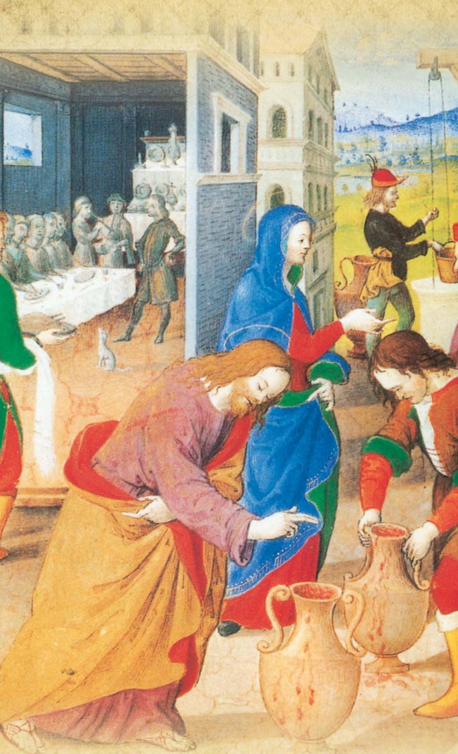
Ilustración del "Manuscrito Palatino", Biblioteca Palatina, Parma.